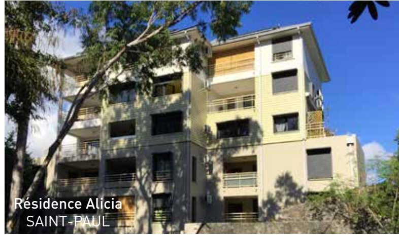
Résidence Alicia SAINT-PAUL