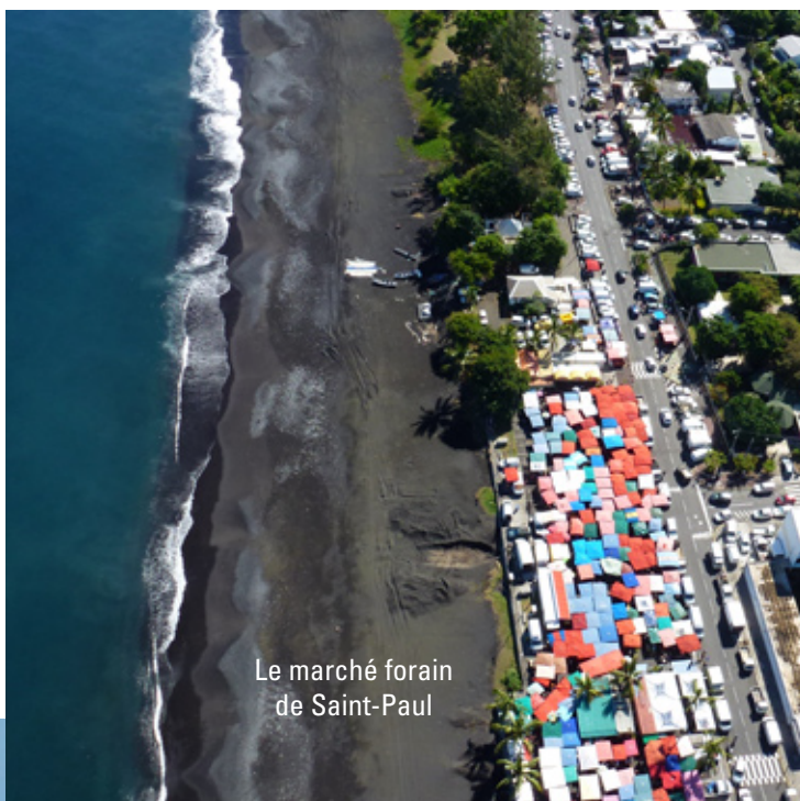
Le marché forain de Saint-Paul

La résidence Alicia bénéficie d'une situation exceptionnelle : elle est implantée dans un quartier résidentiel calme et arboré, au cœur du Front de Mer de Saint-Paul, dans une impasse. Elle bénéficie d'un accès piéton direct au bord de mer par un parc boisé qui jouxte la résidence et qui offre de nombreuses places de parking.