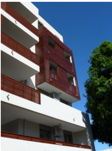
Nos dernières réalisations